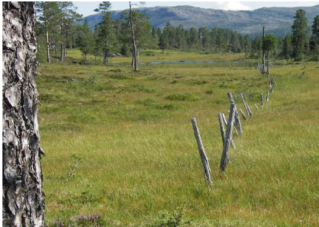
Gjerdet har sett sine beste dager. Her ved Gråvvådalstjønna 2006.

Det ble inngått en 20 års overenskomst med Værdalsbruket. Dyr fra gårder med seterrett i området, og med beiterett på brukets grunn, ble tillatt avgiftsfritt, mens dyr fra gårder uten beiterett på bruket skulle betale årlig avgift på kr 1 pr dyr. Det ble gitt tillatelse til å sette opp gjerde fra Stortjønnfjellet over Kolstadklumpen til Breivadet i Skjækra og videre på sørsiden av Skjækra fra Breivadet til Hardbaksæteren.