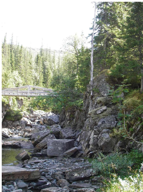
Endepålen i Hardbakskaret reiser seg som en flaggstang midt i bergskrenten.