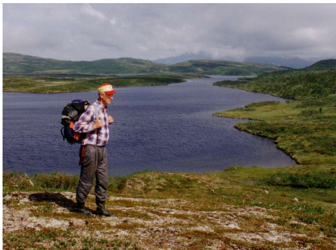
På Stortjønnfjellet dannet vannene naturlige stengsler for oksene. Flott fjell i finvær, men . .